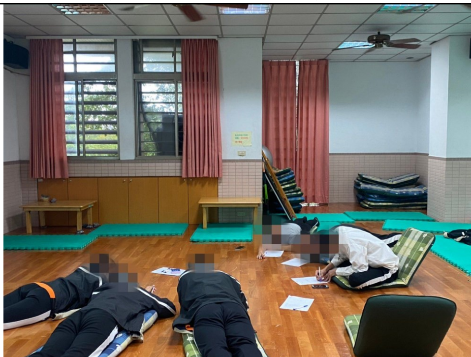
透過愛情卡讓學員更加認識在選擇伴侶時的要求及條件