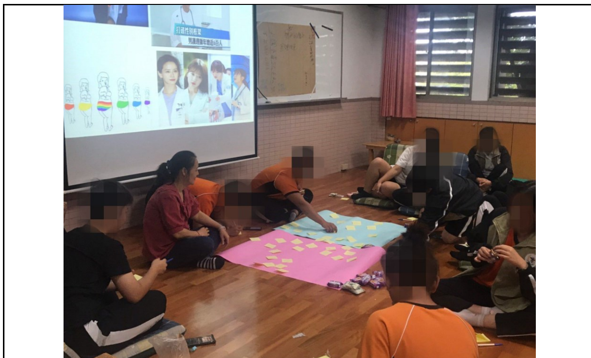
透過性別特質讓學員了解檢視性別的屬性

實施日期：109年9/16、9/23、9/30、10/14、10/21、10/28、11/11、11/18，共八次