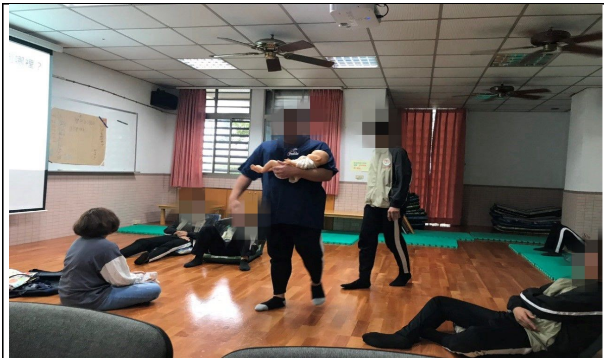
與學員分享當母職時需要做哪些事情及育兒照顧情況

實施日期：109年9/16、9/23、9/30、10/14、10/21、10/28、11/11、11/18，共八次